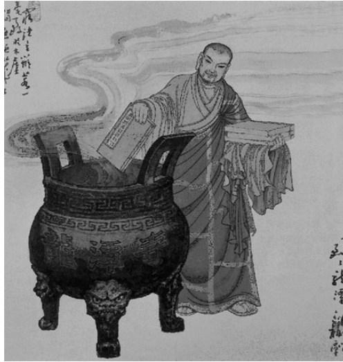
Chu Kim Cang Đốt Thanh long số sao