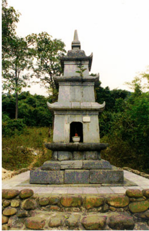
Tháp Thiên sư Chân Nguyên tại Chùa Lân – Thiên Viện Trúc Lâm Yên tử.